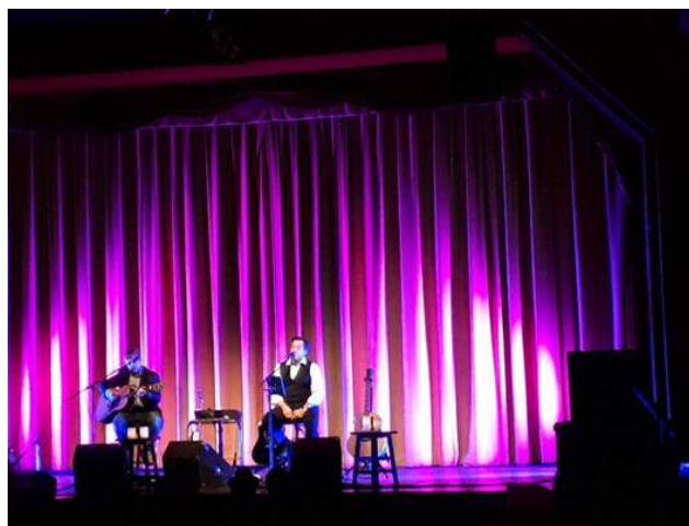
Spectacle Tennessee Two

Ainsi, samedi le 20 octobre, le spectacle de la programmation culturelle Tennessee Two, qui rendait hommage à Jonny Cash, a été présenté par le CCB au Vogue Theater. Malgré la nouveauté de la chose, ce spectacle a été un vrai succès. Le monde a répondu à l'invitation, aussi bien les francophones que les anglophones et tous ont adoré le spectacle. Ce partenariat nous permis non seulement de faire découvrir à notre communauté de l'existence d'un autre théâtre qui a ouvert ses portes récemment à Miramichi, mais aussi, et surtout de promouvoir le rayonnement de la communauté acadienne et francophone partout à Miramichi. Des commentaires comme " C'était un très bon spectacle " ou " Je ne savais pas que le Carrefour faisait ça ", démontrent la pertinence de ce projet et le besoin d'élargir les horizons dans les années à venir.