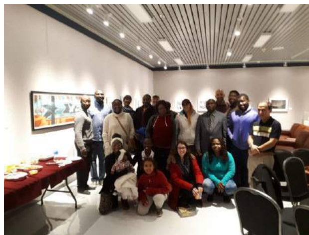
Première rencontre officielle des nouveaux arrivants de Miramichi au CCB

La première rencontre a donc eu lieu le dimanche 21 octobre dans la Galerie ARTcadienne avec une présence de 20 personnes qui ont pu se rencontrer autour de la culture africaine qui les rassemblait de près ou de loin. Ainsi, il y avait des personnes d'origine du Cameroun, du Burkina Faso, de l'Algérie, du Nigéria, de la Zambie, de la France, de l'Haïti et du Burundi avec plus de 70% qui sont francophones. Une représentante de l'association multiculturelle de Miramichi était présente également.