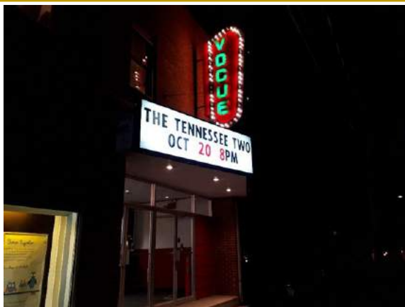
Le Vogue Theatre vu de l'extérieur

Une des missions du Carrefour communautaire Beausoleil (CCB) est de promouvoir le rayonnement de la communauté acadienne dans la région de Miramichi. C'est dans ce cadre que le CCB a choisi de faire un partenariat avec Le Vogue Theatre, un ancien théâtre de Chatham qui date de 1950. Ayant fermé ses portes en 2000, Le Vogue est de nouveau fonctionnel depuis quelques années.