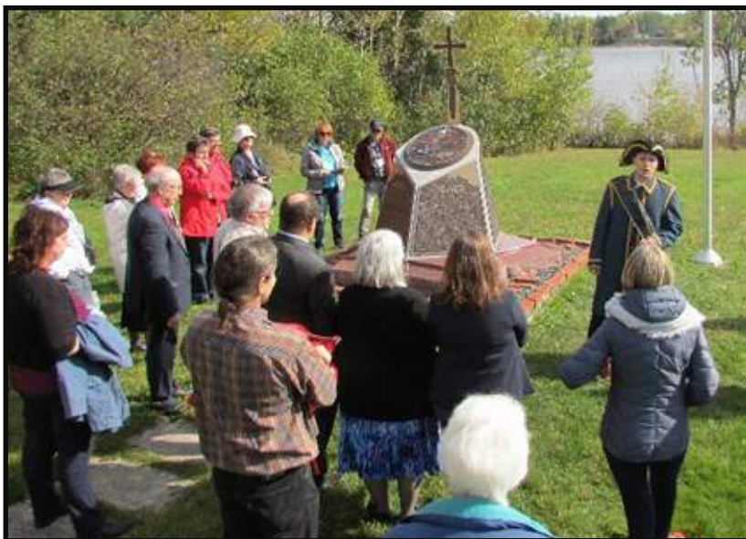
Certains participants à la cérémonie au Monument du grand Déangement à la Pointe Wilson