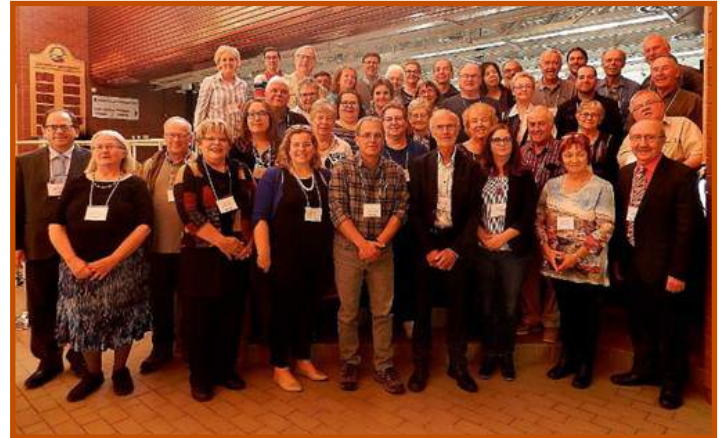
Le groupe de participant au 10e Forum

Le Carrefour communautaire Beausoleil en collaboration avec les Amis de L'Île étaient hôtes du 10e Forum acadien - histoire et patrimoine qui s'est déroulé à Miramichi, et principalement au Carrefour communautaire Beausoleil du 6 au 8 octobre dernier. Une cinquantaine de personnes passionnées de l'histoire acadienne se sont déplacées pour une fin de semaine de conférences et visite du site du monument du Grand Déangement. Les participants venant du N.B., I.P.E., N.E. et Québec ont aussi visités le centre d'interprétation Beaubears et le Governor's Mansion.