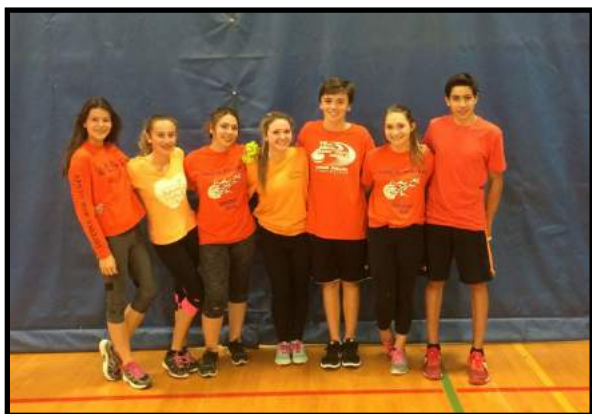
la Journée du chandail orange

Comme la vie étudiante est très mouvementé et puisqu'une image vaut mille mots, nous vous laissons également le plaisir d'admirer des photos prises durant ces nombreuses activités depuis le début de l'année scolaire.