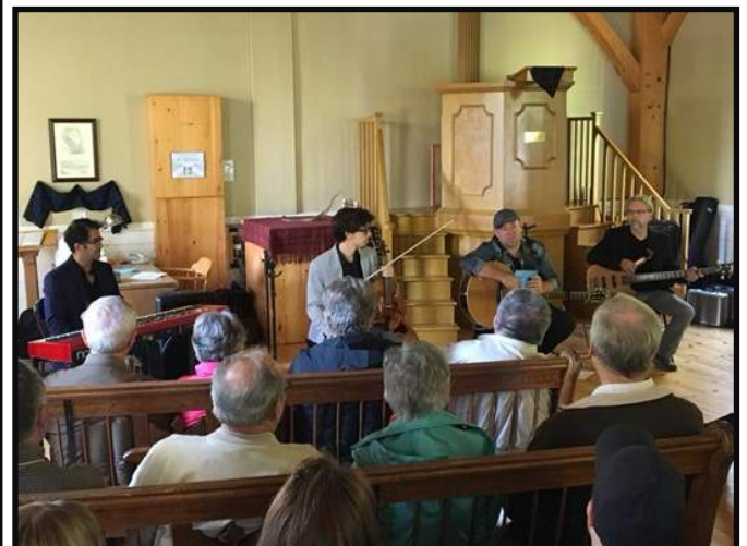
Surprise musicale avec Danny Boudreau et ses musiciens