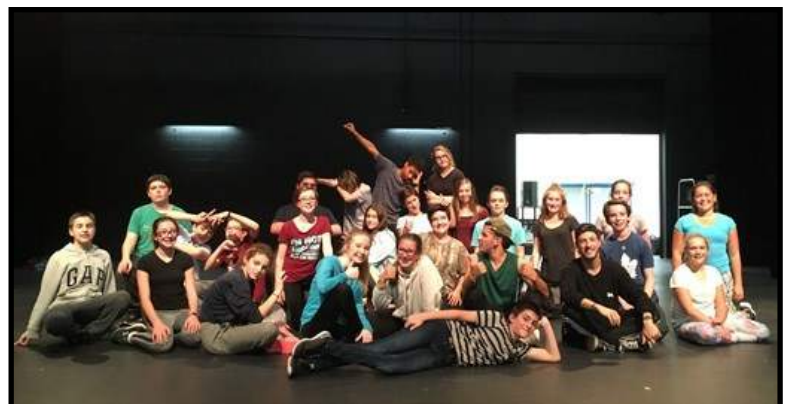
Atelier de danse avec Aetas.