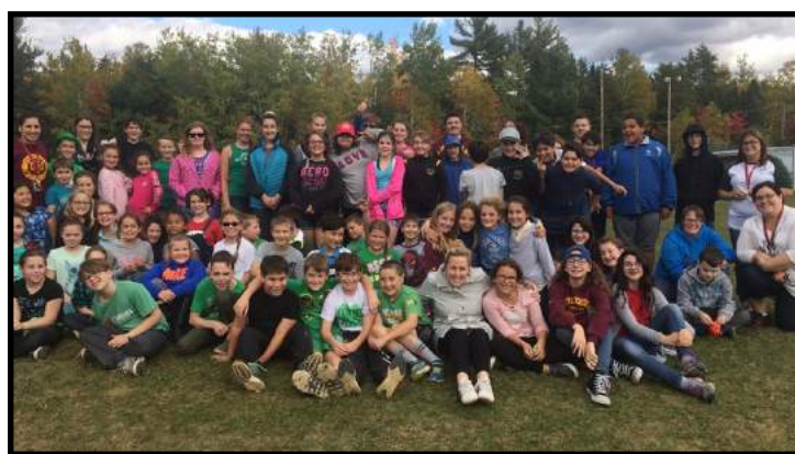
Marche du mieux-être