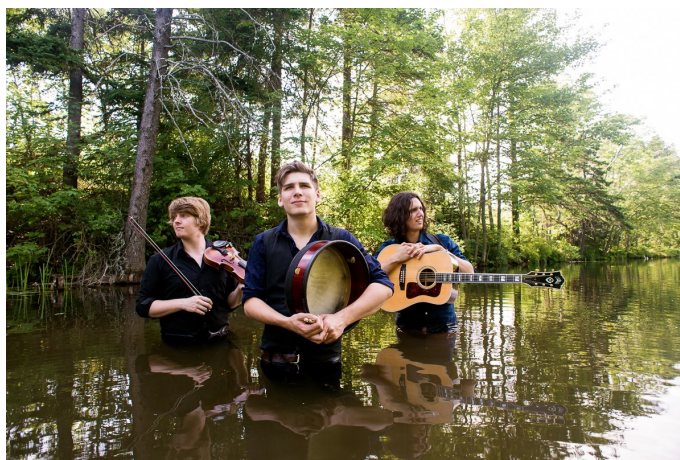
Ten Strings And A Goat Skin