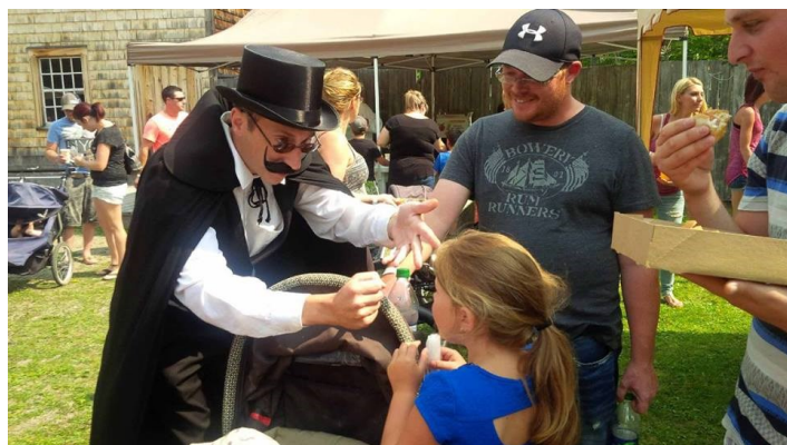
Allard, le magnifique