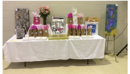
Prix des généreux commanditaires