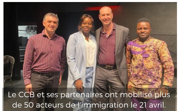
Le CCB et ses partenaires ont mobilisé plus de 50 acteurs de l'immigration le 21 avril.

Le 21 avril, plus de 50 partenaires se sont réunis au Carrefour communautaire Beausoleil à l'occasion du 1er forum du développement économique et de l'immigration francophone de Miramichi. Objectif: trouver des solutions pour mieux attirer, accueillir et intégrer les immigrants francophones sur le long terme.