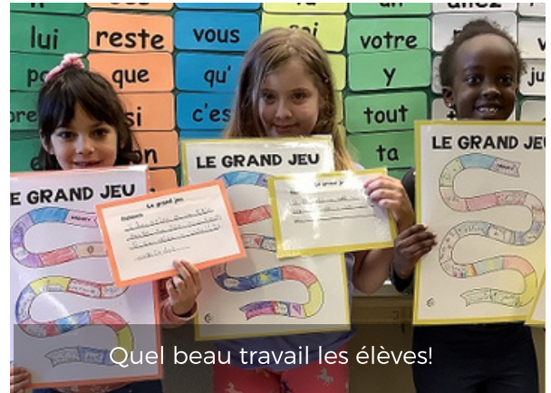
Quel beau travail les élèves!